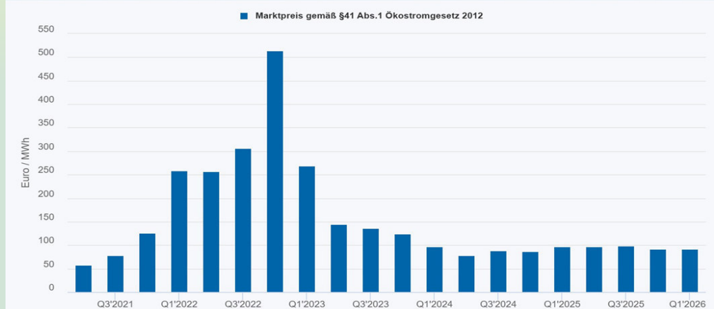
Marktpreisentwicklung (ab dem 2. Quartal 2019 auf Basis Phelix-AT) Marktpreis gemäß §41 Abs.1 Ökostromgesetz 2012

* Ökostrom wird zu diesem Marktpreis abgenommen, wobei dieser monatlich um bis zu 40 % reduziert sein kann, wenn der Spotmarktpreis unter dem vierteljährlichen Marktpreis der OeMAG liegt.